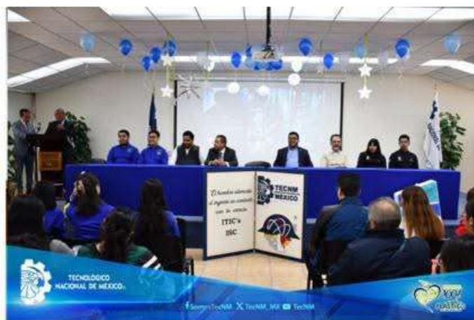
Integrantes del presidium